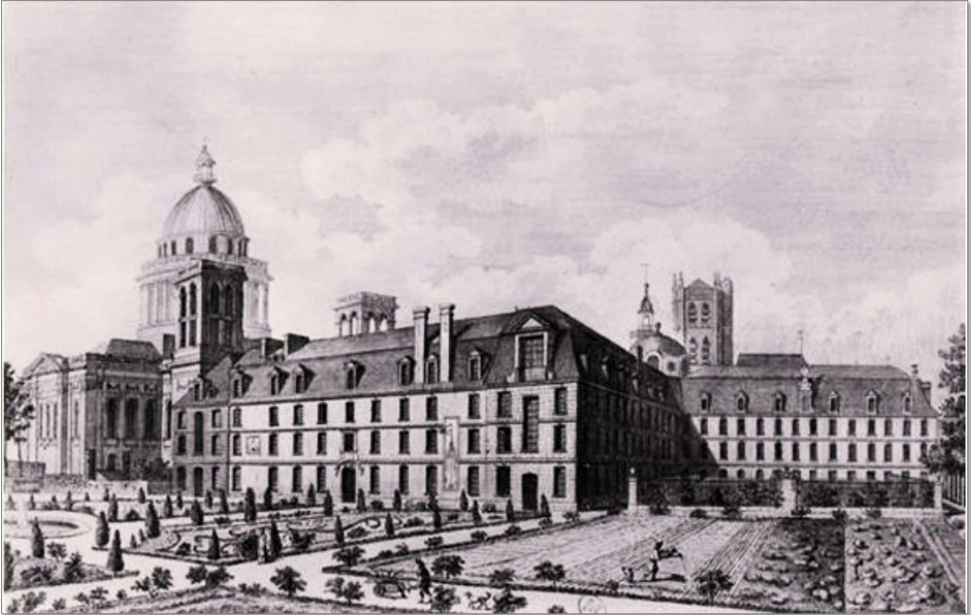
L'abbaye Sainte Geneviève et, au second plan, les deux clochers de la nouvelle Eglise, au XVIIIe siècle.